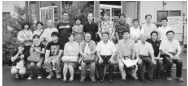
(先進地視察研修：おおむら夢ファームシュシュ、H22.7.3、大村市)

発表会では、新しい農・商・医・教育・地域の融合による新たなビジネスプランの提案、土地利用型農業の経営改革プランの提案、太陽光発電の農業的利用、農業キッズ公園の具体化、集落営農の法人化、地域金融機関の農業への貢献方策など、いずれも自ら直面している課題を取り上げた研究発表が多く、その内容は具体的で外部審査委員からも高い評価を受け、また大学院生や学部学生にとっても非常にいい刺激になりました。