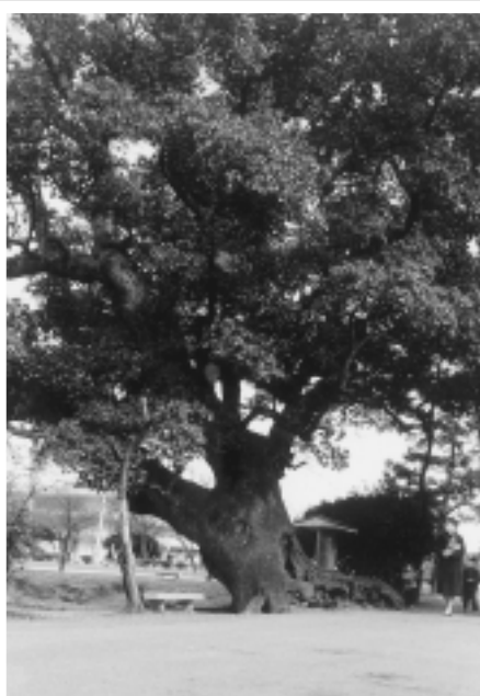
写真1：県庁前の「大楠」

写真1 「大楠」は佐賀県庁行政棟正門の西側の大楠で、遠景の3階建ては郵便局（現在は「日本郵便佐賀支店」）です。いずれも現存しています。平成10年2月に堀越道路（くすのさかえはし）ができましたが、お堀の周りには今も大楠が佐賀のシンボルとして年輪を重ねています。