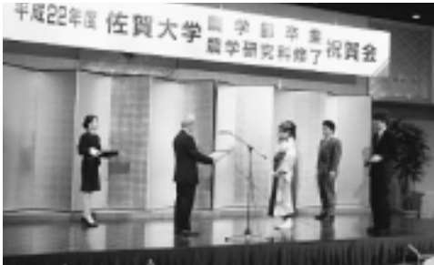
農学部同窓会長賞の授与