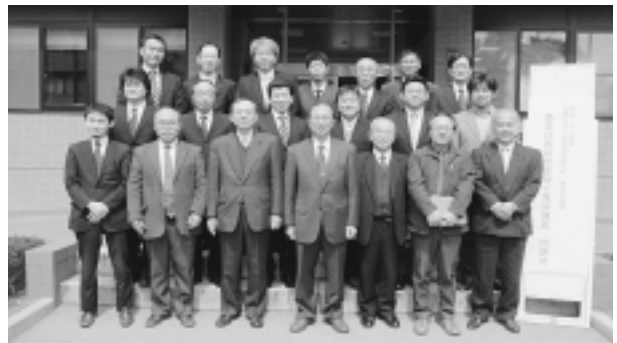
(農業版 MOT コース修了式、H23.3.24、農学部玄関で)

受講者からは「幅広い視点から科学的に物事を考える機会になった」、「異業種の人と交流でき、事業の提携の話が具体化した」、「いつでも大学に相談できる関係ができた」、「若い人に農業版 MOT 受講を強く勧めたい」、「もっと多くの科目を履修したかった」などさまざまな意見があった。これらの意見を大切にしながら大学院教育の実質化や社会貢献も含めて、さらに創意工夫をしていくことが必要であると思っている。