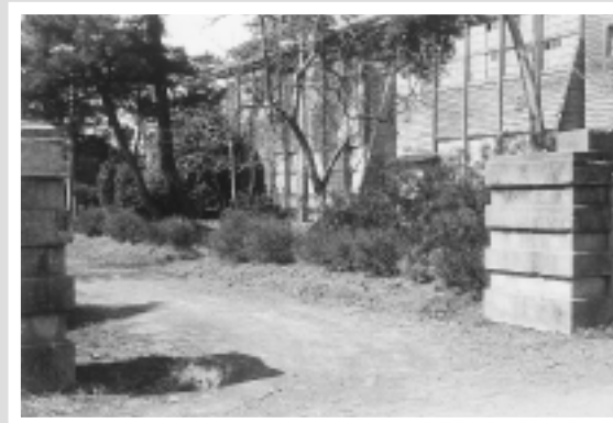
写真3：附属農場の「門柱と校舎」