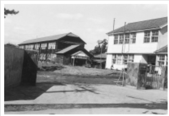
写真2：旧農学部の「門柱と校舎」

写真3 「附属農場」は東側の道路からのもので、木造2階建ての建物は鉄筋コンクリートの建物に建て替えられていますが、門柱は今も現存しています。なお附属農場は現在、「佐賀大学農学部附属資源循環フィールド科学教育研究センター」となっています。